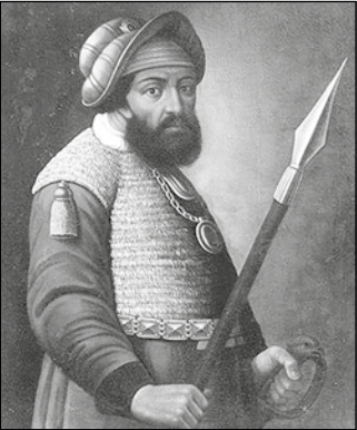
Атаман Ермак Тимофеевич

XX век стал временем тяжелых испытаний для Церкви на тюменской земле. В годы так называемой «безбожной пятилетки» были осквернены и разрушены десятки храмов. Свято-Троицкий монастырь был закрыт и разорен, величественный Благовещенский собор взорван, другие церкви превращены