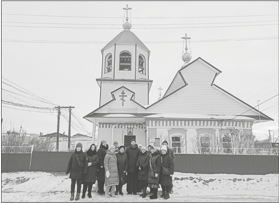
Паломники у храма с. Рафайлово