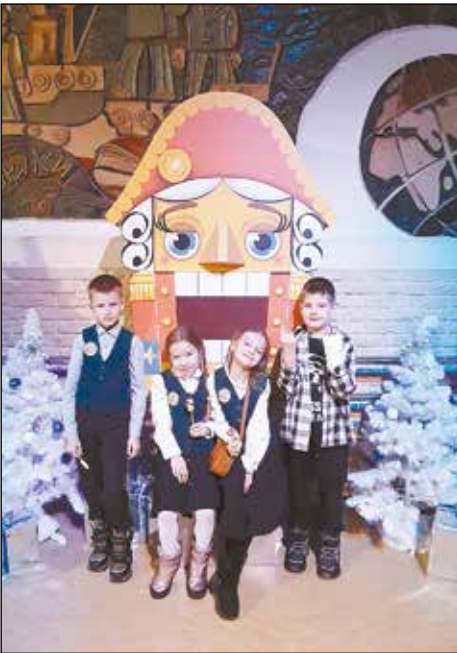
В театре кукол