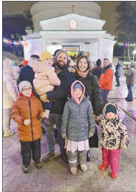
В храме всей семьей