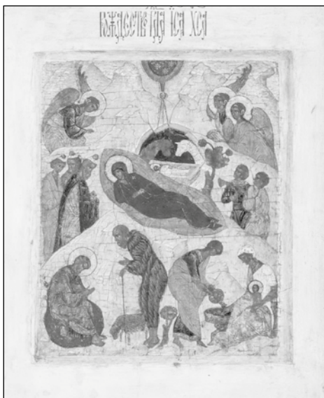
Икона Рождества Христова

Еще раз в нашей жизни сподобил нас Господь праздновать величайшее в истории мира событие, которое несказанно изумило всех ангелов небесных. Они увидели сошедшего на землю с небес Предвечного Сына Божия, Второе Лицо Святой Троицы, во плоти человеческой, которую благоволил