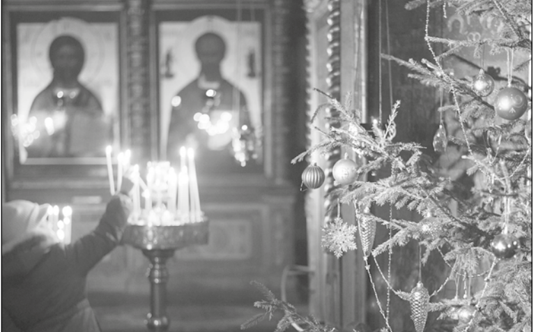
В храме на Рождество Христово

Когда, измученная этими своими токсикозными манипуляциями, я попыталась присесть в храме на лавочку, какая-то внушительных размеров дама сказала мне: «Молодая еще, постышись». Я попыталась объяснить ей, что я беременная, что у