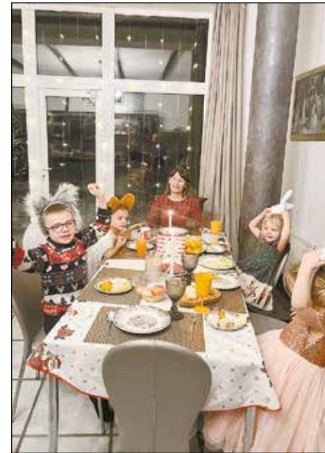
За праздничной трапезой