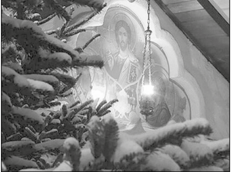
У православного храма

годы, я оказалась в храме, вышла замуж. И вот она, моя первая рождественская служба в маленьком украинском храме. Я к ней очень готовилась, ожидая чего-то необычного, волшебного. Чего я никогда не чувствовала в детстве на Новый год. Еще я собиралась причащаться. И нарядилась по случаю праздника в свое самое красивое платье. Но у меня заканчивался второй месяц беременности. Половину службы я провела в своем ослепительном наряде и с обострившимся вдруг токсикозом в прихрамовых кустах.