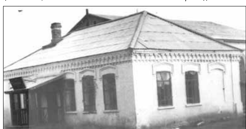
Здание бывшей церковно-приходской школы в селе Истошином

Из истории Екатерининской церкви села Истошинского, приведенной в Справочной книге Тобольской епархии за 1913 год: «Первый храм был построен в 1765 г., второй, тоже деревянный, в 1806 г., настоящий храм, каменный, построен в 1853 г. во имя святой великомученицы Екатерины; к нему пристроен был в 1892 г. придел во имя Святой Троицы, а в 1910 г. построен был второй придел, с южной стороны, в честь иконы Божией Матери «Утоли моя печали». Особенно почиталась прихожанами и жителями соседних селений икона Божией Матери «Утоли моя печали». Икона эта была написана в Москве и в 1901 г. 8 июня была принесена в село Истошино. В память сего великомученицы Екатерины установлено ежегодное празднование 8 и 9 июня. В эти дни собиралось множество богомольцев в село; после 9 числа икона обноси-