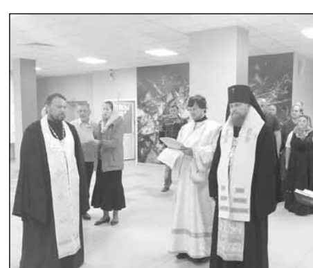
По материалам сайта Салехардской епархии

В день праздника Преображения Господня в городе Муравленко был освящен новый крытый хоккейный корт с искусственным льдом. Строительство уже практически завершено. Комплекс предназначен для зимних спортивных игр на льду и фигурного катания. Владыка Нико-