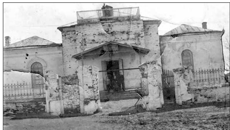
Здание бывшей Екатерининской церкви в селе Истошином. Фото 1930-х гг.