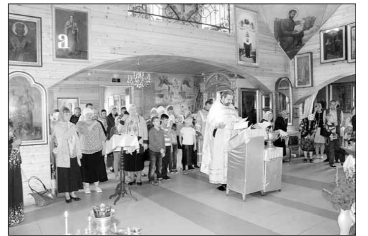
По материалам сайта Ишимской епархии

водой и сказал напутственное слово перед началом учебного года.